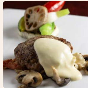
黒毛和牛と霧島山麓豚の ハンバーグ Wagyu Beef and Pork Hamburger Steak