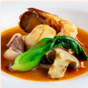
オマール海老と魚介の ブイヤベース Bouillabaisse Lobster and Seafood