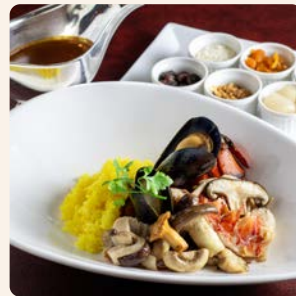
シェフ特製 オマール海老ときのこのカレー Chef's Special Curry Lobster and Mushroom