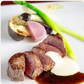
牛フィレ肉のグリル トリュフとチーズソース Grilled Beef Fillet with Truffle and Cheese Sauce