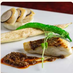
本日の魚料理 Today's Fish Dish