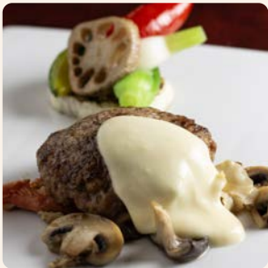
黒毛和牛と霧島山麓豚の ハンバーグ Wagyu Beef and Pork Hamburger Steak ¥6,500