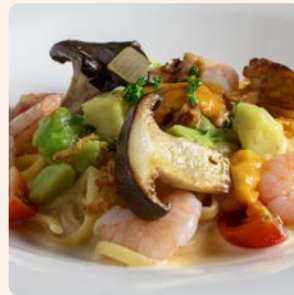
平日限定 本日のパスタ Today's Pasta ¥4,800