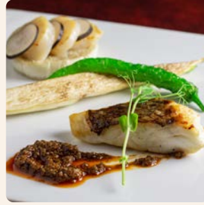
本日の魚料理 Today's Fish Dish ¥5,500