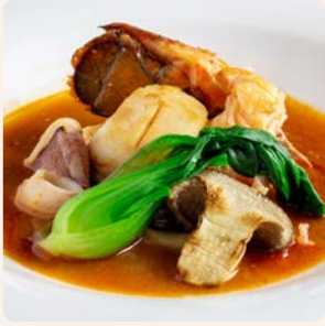
オマール海老と魚介の ブイヤベース Bouillabaisse Lobster and Seafood ¥7,500