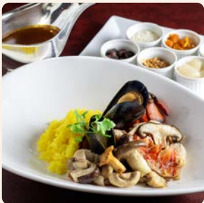
シェフ特製 オマール海老ときのこのカレー Chef's Special Curry Lobster and Mushroom ¥6,500