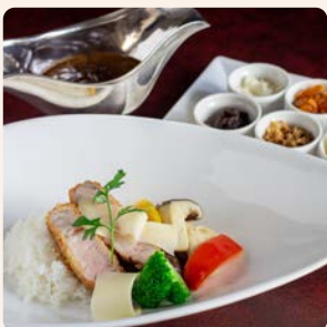
神戸ポークカツの スパイシーカレー Spicy Curry Kobe Pork Cutlet ¥6,500