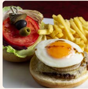
9/1~15限定 黒毛和牛と霧島山麓豚の 月見ハンバーガー Wagyu Beef and Pork TUKIMI Hamburger ¥5,500