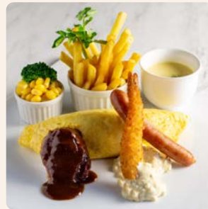
チャイルドプレート (3~6歳) Child Plate (3 to 6 years old) ¥800