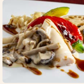
鶏胸肉のシュープレーム チーズときのこのクリームソース Chicken Supreme Cheese and Mushrooms ¥6,500