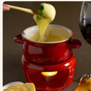
お一人様1個付き チーズフォンデュ (グリュイエール・クリームチーズ) Cheese Fondue *one by one Gruyère or Cream Cheese