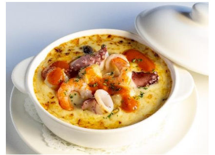
シーフードドリア ¥2,200