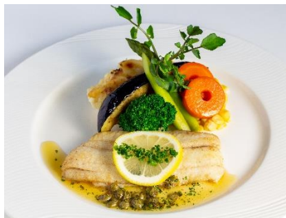
舌平目のムニエル 焦がしバターソース ¥2,500