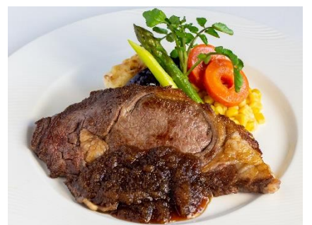
リブロースステーキ ¥2,500

当キッチンではアレルギー食品（アレルゲン特定原材料およびそれに準ずる原材料）を含むメニューも調理しております。 不耐性のあるお客様はあらかじめご了承ください。表記の価格は、サービス料10%と税金を含んだ総額表示といたしております。