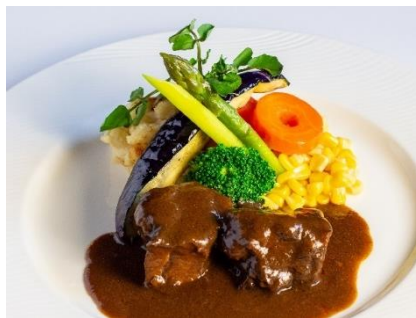
黒毛和牛のビーフシチュー ¥2,200