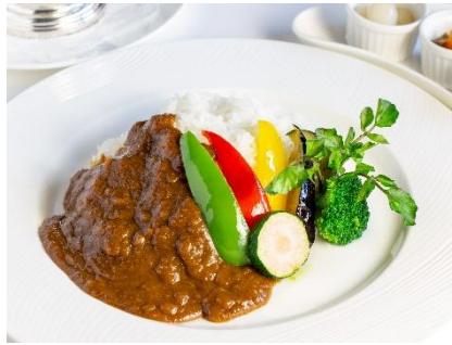
ホテルメイド 野菜カレー ¥2,200