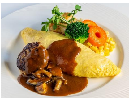
オムライスとハンバーグ ¥2,500