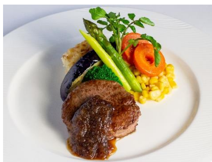
ビーフフィレステーキ ¥2,500