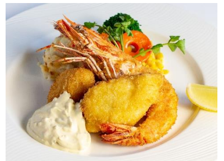
シーフードのミックスフライ タルタルソース ¥2,200