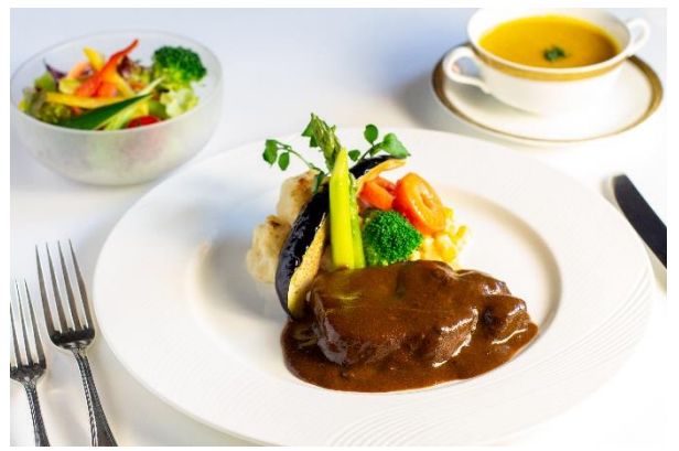
アマデウス名物 牛タンシチュー ¥2,500