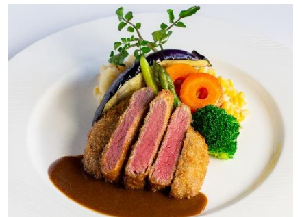
ビーフカツレット デミグラスソース ¥2,500