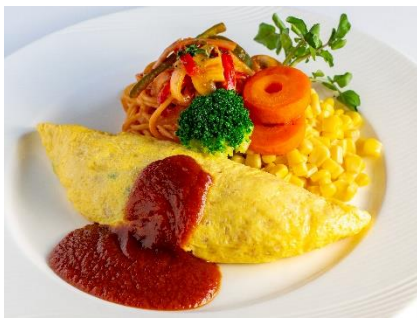
昔懐かしオムライスと ナポリタンスパゲティ ¥2,200