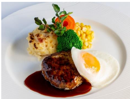
黒毛和牛と霧島山麓豚の ハンバーグ ¥2,500